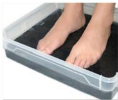
Schungit-Fußmassage Set Art. Nr.: 173

Schungit wird auch gerne für Energiebäder zur Tonus Steigerung benutzt. Für diesen Zweck können einzelne Steine oder auch kleinere Steine als Splitt verwendet werden. Splitt können Sie in einem Baumwollsäckchen in die Badewanne legen oder als natürlichen Splitt ohne Säckchen anwenden. Letzterer eignet sich besonders für Fußbäder. Nehmen Sie die positive Schwingung des Schungits auf, er gibt Ihnen Kraft und Vitalität für den ganzen Tag. Bitte nehmen Sie keine Schungit-Bäder vor dem Schlafengehen.