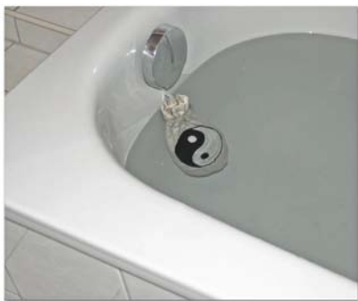
Schungit-Badezusatz, Yin-Yang, 300 g, Art. Nr.: 168

Eine energetische Reinigung, z. B. durch Sonnenstrahlen, ist auch zu empfehlen.