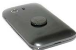
Schungit-Schutzplättchen, klein, poliert, rund, Größe: Ø 20 x 2,5 mm, Art. Nr.: 111

Der kleine Schungit Schutzstein eignet sich hervorragend zum Einsatz an Mobiltelefonen. Untere Fläche an dem Plättchen ist selbstklebend und kann sicher an einem Telefon befestigt werden. Die Funktion des Gerätes wird dadurch nicht beeinträchtigt.