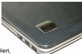
Schungit-Schutzplättchen, groß, poliert, viereckig, Größe: 25 x 25 x 5 mm, Art. Nr.: 162

Untere Fläche des Plättchens ist selbstklebend, so lässt sich der Stein einfach und sicher befestigen. Schungit kann einen dauerhaften, energetischen Schutz gegen die Einflüsse der negativen Strahlen bieten.